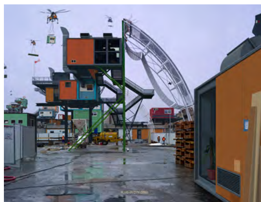
Alain Bublex, Plug-in City (2000) - Montpellier Saint-Roch 1 , 2013, épreuve chromogène laminée diasec sur aluminium, 180 x 240 cm, courtoisie de l'artiste et de la galerie G.P. et N. Vallois, Paris. © Adagp, Paris, 2013. Avec le soutien de Vinci Construction France.

(3) p. 96, cat. Alain Bublex , Flammarion, 2010