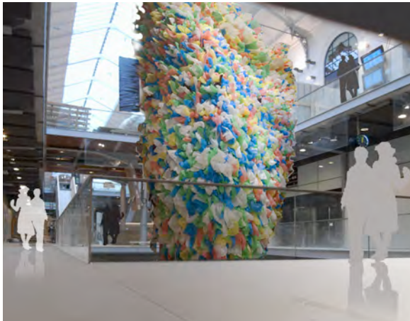
Pascale Marthine Tayou, Plastic Bags , dans l'atrium central de la gare Saint-Lazare

entreprisecontemporaine® a le plaisir d'annoncer la réalisation collective, par des agents SNCF et des voyageurs de la gare de Paris Saint-Lazare, tous volontaires, de l'œuvre « Plastic Bags » de l'artiste Pascale Marthine Tayou, au cœur du plus grand espace commercial jamais ouvert en France dans une gare, et à quelques mètres des quais où un autre artiste dressa son chevalet en 1877 : Claude Monet.